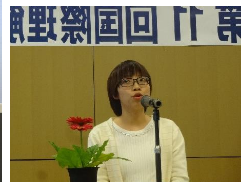
ハンさん・ベトナム