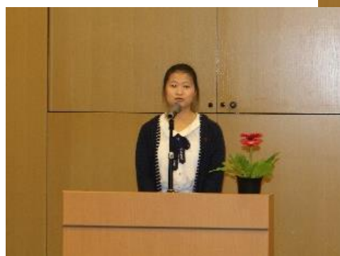
こ ちゅうごく 胡さん・中国

だい ぶ にほんご にんぜんいんす ば 第1部：日本語スピーチコンテスト。6人全員素晴らしいスピーチでした。