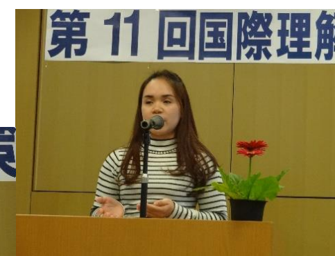
ミッシェルさん・フィリピン