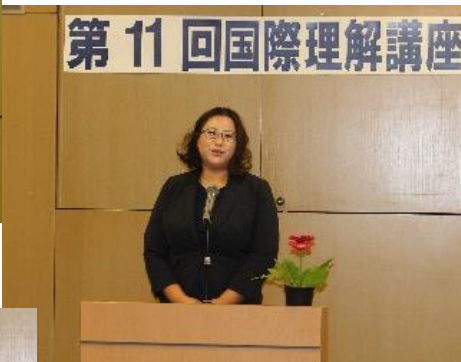
はやし ちゅうごく 林 さん・中国