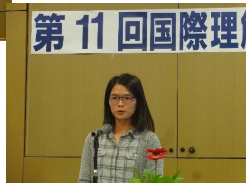
リンさん・ベトナム