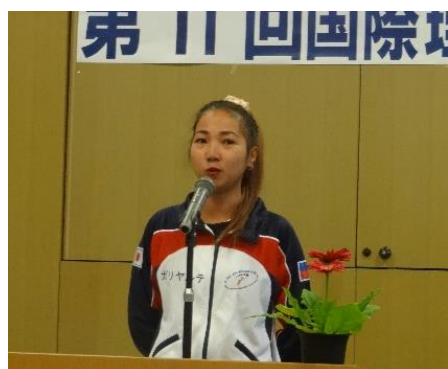
ライザさん・フィリピン